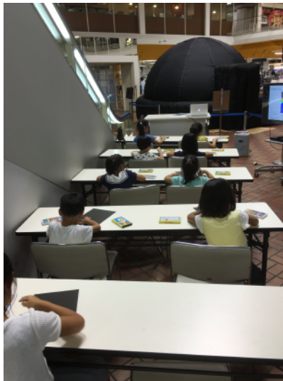
子どもたちの作業はクレパスで絵を描くだけ。ガラスビーズを扱う作業はスタッフが実施します